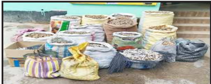
খানাকুল থানার নতিবপুর বরখানতলা এলাকা থেকে প্রায় ৬ কুইন্টাল অবৈধ শব্দ বাজি উদ্ধার করল খানাকুল থানার পুলিশ।